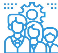
Gestão de Recursos Humanos